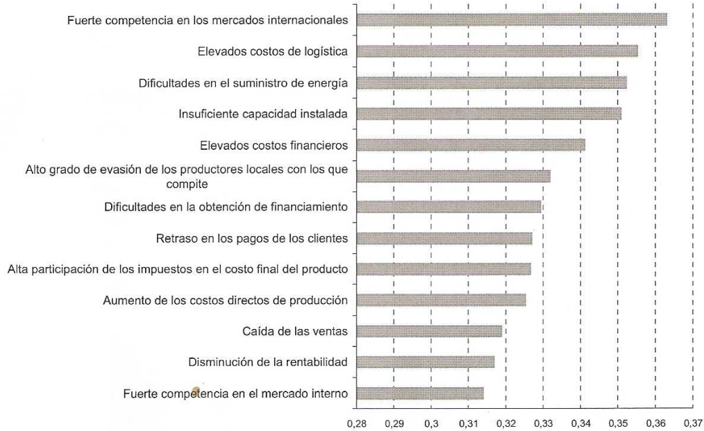
Gráfico 2 - Problemas y competitividad: Índice de Competitividad de las PyME industriales de acuerdo a cuáles fueron los principales problemas del empresariado durante 2009.