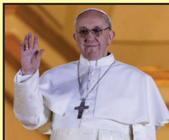
Vaticano: Audiencia Papal