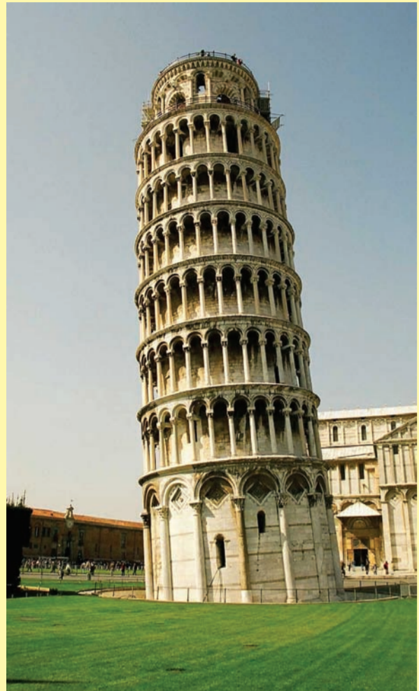
Pisa: Torre Inclinada

PARTICIPE EN EL VIAJE ESPECIAL PARA LA DELEGACIÓN ARGENTINA