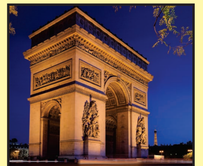
París: Arco de Triunfo