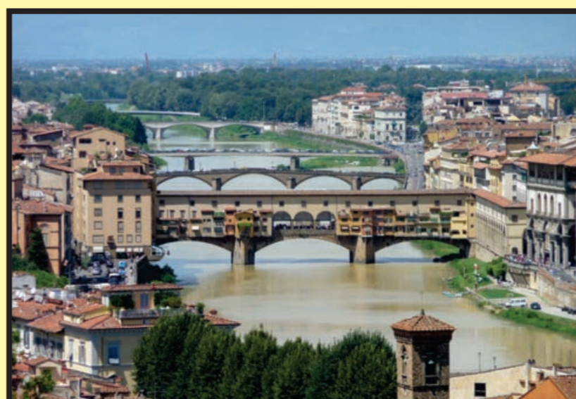
Florencia: Río Arno