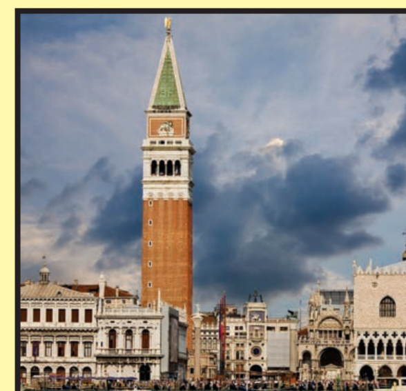
Venecia: Plaza San Marcos