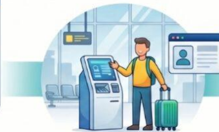
Validación Aduanera Sistémica El turista debe exhibir la mercadería y validar el reintegro en terminales de autogestión.