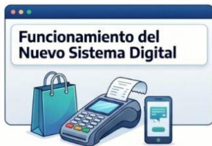
Emisión y Validación Electrónica Las ventas (mínimo $70, Comprobante B) generan cheques electrónicos con trazabilidad digital completa.

Res Gral 5843/2026. IVA. Turistas del exterior. Reintegro. Compras nacionales. Sistema digital. Aduana. Comercios. Sustitución