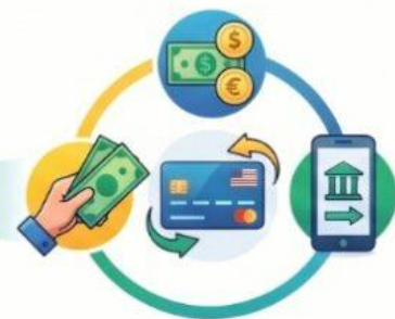
Reembolso y Vigencia Devolución vía efectivo, tarjeta extranjera o giro, con validez de 6 meses.